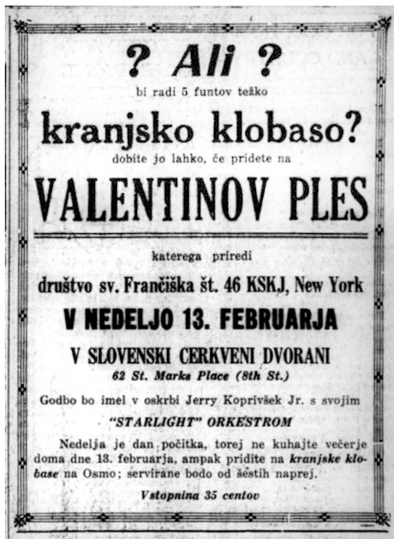
Slika 1: S katero jedjo so se mastili na »valentinovem plesu« društva Sv. Franciška iz New Yorka 13. februarja 1938? (vir: Glasilo K.S.K. jednote , 9. 2. 1938, 7)