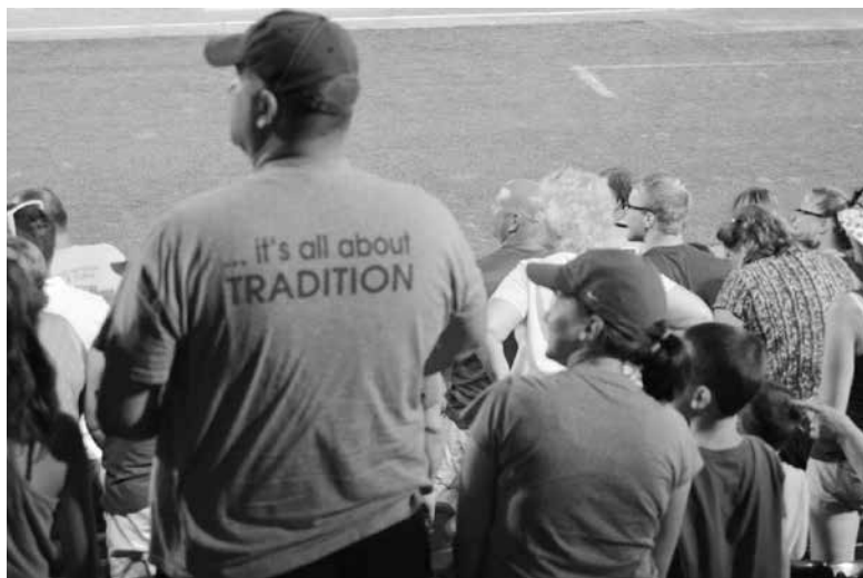
Slika 2: Utrinek z bejzbol tekme, posvečene slovenski kulturni dediščini in polki.

Z večjo grenkobo pa o tematiki govori njegov kolega (intervju 2), ki pravi, da otroke slovenstvo le malo zanima, da jih pogovor o koreninah hitro zdolgočasi. Tudi intervjuvanca 8 družina ne podpira pri njegovem zanimanju za slovenske korenine, pravi pa, da so se sčasoma tega navadili. Intervjuvanka 5 ima dva brata in dve sestri, a nihče med njimi ne kaže zanimanja za slovenstvo. To se mu zdi razumljivo, saj družinam primanjkuje časa. Intervjuvanec 6 pravi, da je od dveh sinov eden navdušen nad slovenstvom, drugi pa prav nasprotno. Podobno je z bratom in s sestrama, a se s tem ne obremenjuje preveč; skrbi ga le, ali bodo znali ceniti izdelavo obsežnega družinskega drevesa. Opazimo torej lahko, da gre za precej individualne projekte; zanimanje je težko prenesti na druge družinske člane. Morda tudi zato, ker se je večina začela zanimati za slovenske korenine v srednjih letih, ko z otroki niso več bili tako tesno povezani.